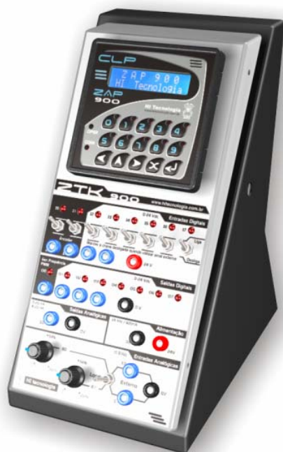
Kit de Treinamento eZTK900